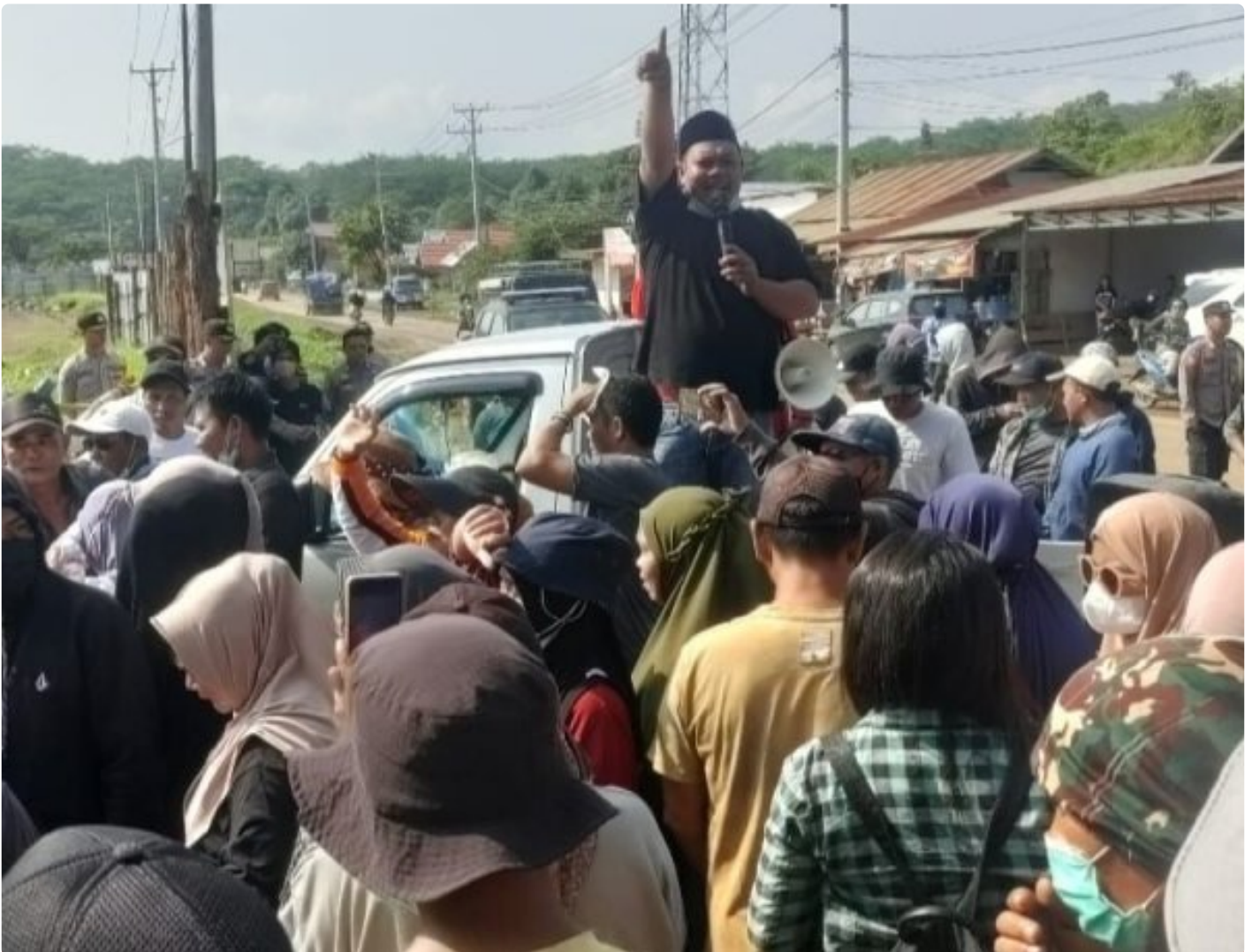
Tampak Korlap Aksi Demo Menyampaikan Orasinya di depan Kantor AFB Desa Lalampu

MOROWALI, Sulawesi Tengah- Tuntutan Aksi Demo yang dilakukan sejumlah warga Desa Lalampu masih menunggu keputusan dari PT Ang and Fang Brother