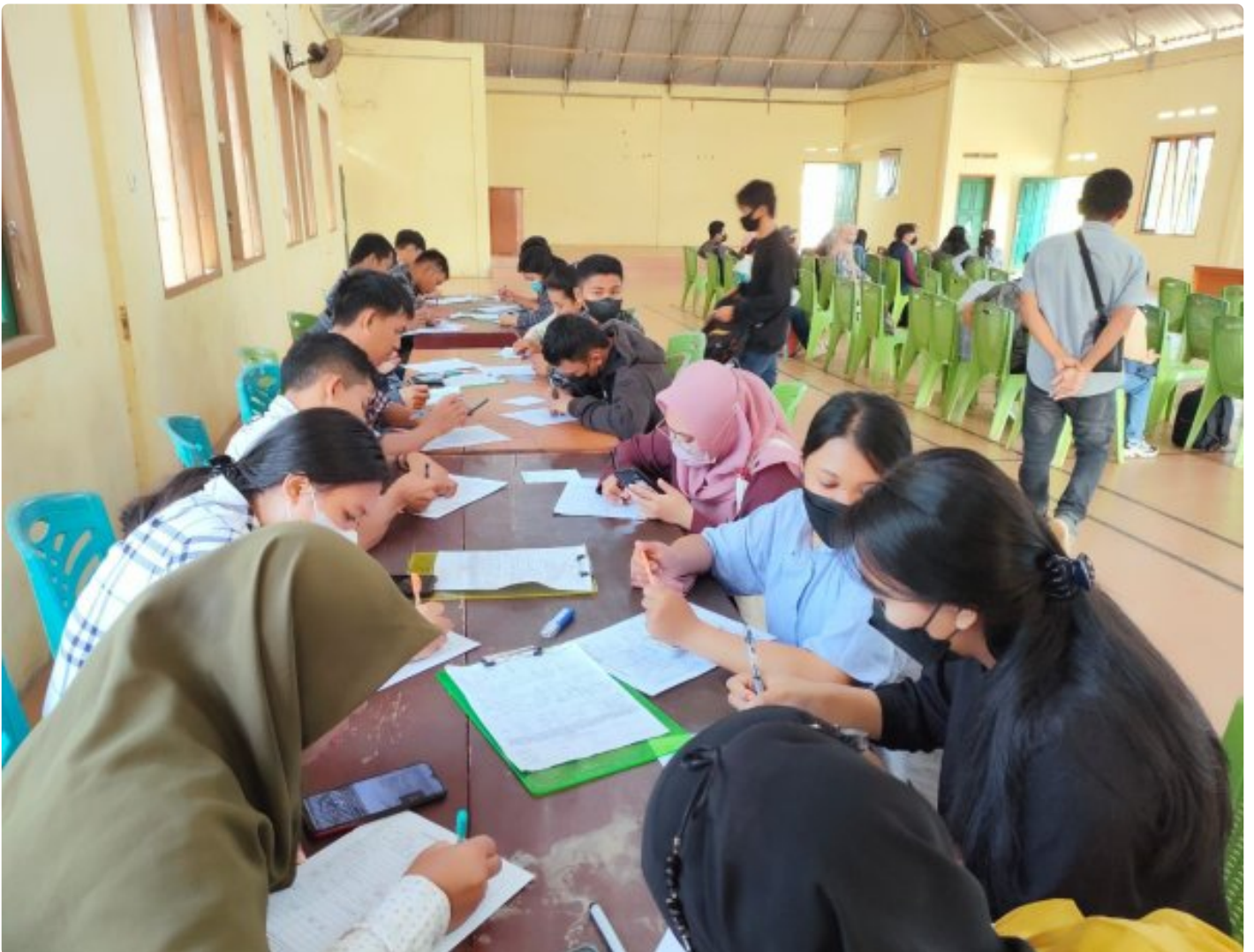
Tampak Antusias Pencaker Ikuti Job fair yang digelar PT GNI di Desa Molino

MOLINO, Morut Sulteng- PT Gunbuster Nickel Industry (GNI) secara beruntun melakukan Job Fair atau perekrutan langsung di sejumlah Desa Kecamatan