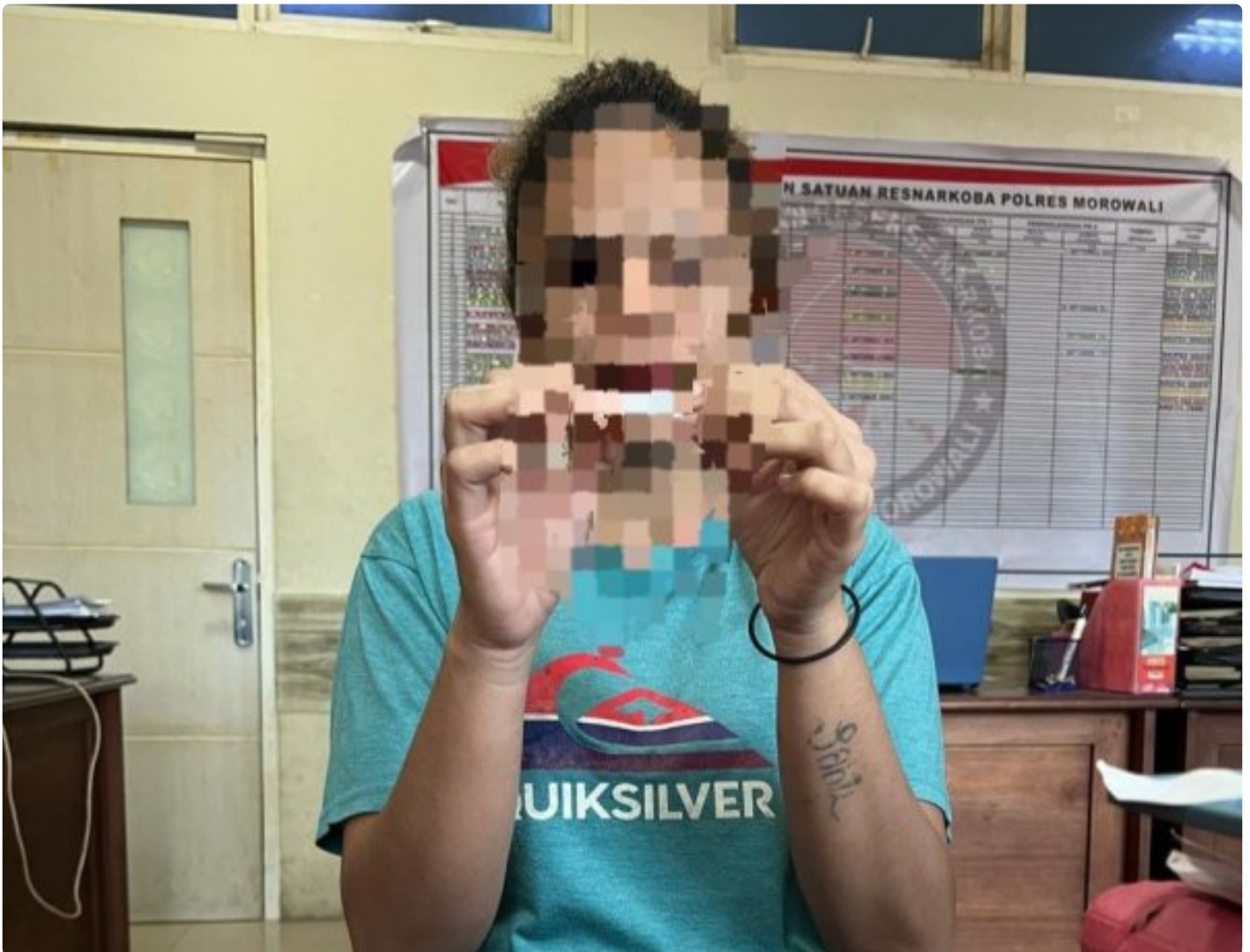
Pelaku Narkotika Seorang Perempuan di tangkap di bahodopi