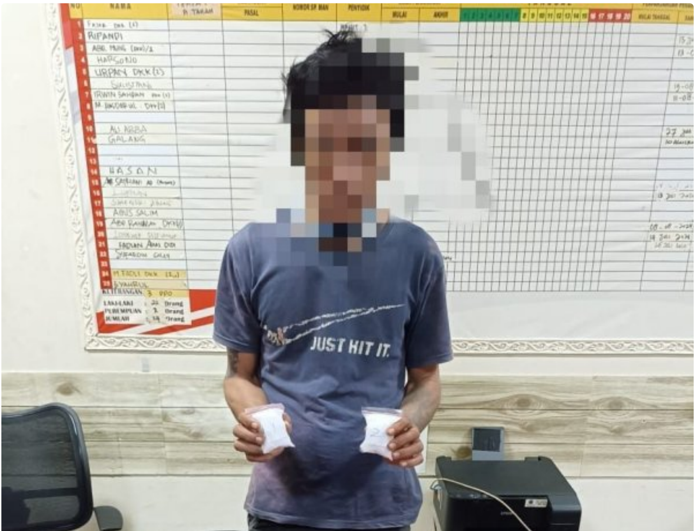
Polres Morowali amankan Pelaku Narkotika dari Bahodopi

MOROWALI, Sulawesi Tengah- Kepolisian Resort (Polres) Morowali berhasil mengungkap kasus Tindak Pidana (TP) Narkotika Golongan I jenis shabu pada Rabu malam (10/07/2024), di Desa Bahomakmur, Kecamatan Bahodopi,